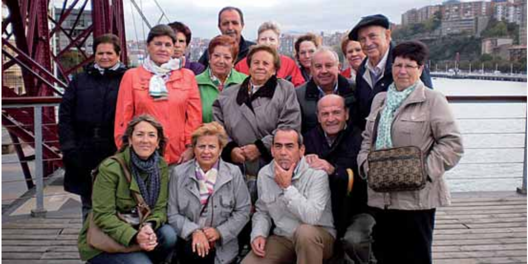
Las personas que participaron en la excursión al Puente Colgante disfrutaron a tope de con la visita.