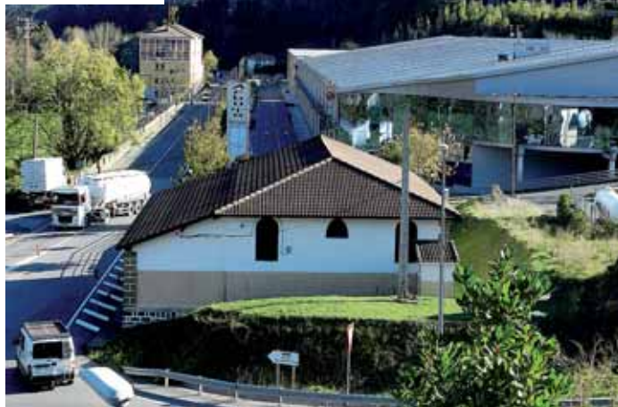
Parque Empresarial de Arbuio.

Concejal de Promoción Económica, Formación, Empleo, Comercio y Turismo