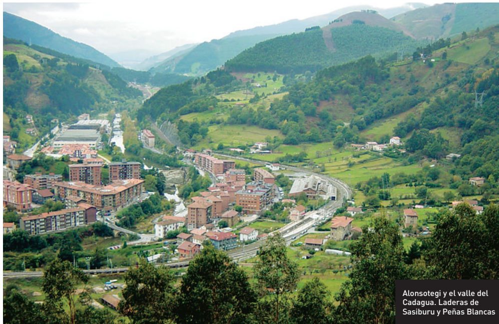
Alonsotegi y el valle del Cadagua. Laderas de Sasiburu y Peñas Blancas