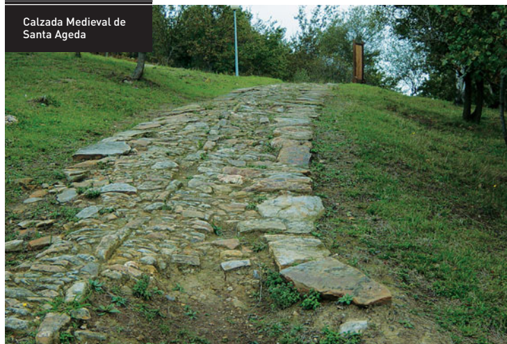
Calzada Medieval de Santa Ageda

La pendiente hacia la ermita de Santa Ageda es acusada. El bosque está conformado por eucaliptos de troncos finos y altos.