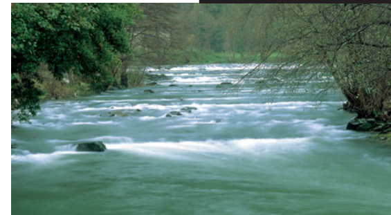
Un tramo del Río Cadagua antes de desembocar en el Nervión

hay una área de recreo y la ermita de Santa Quiteria, que celebra su fiesta el 22 de mayo. El ganado vacuno ocupa los rincones del bosque, en el que prima la encina. Hasta el final del trazado descendemos por una pista vecinal, cuyo firme se encuentra cementado.